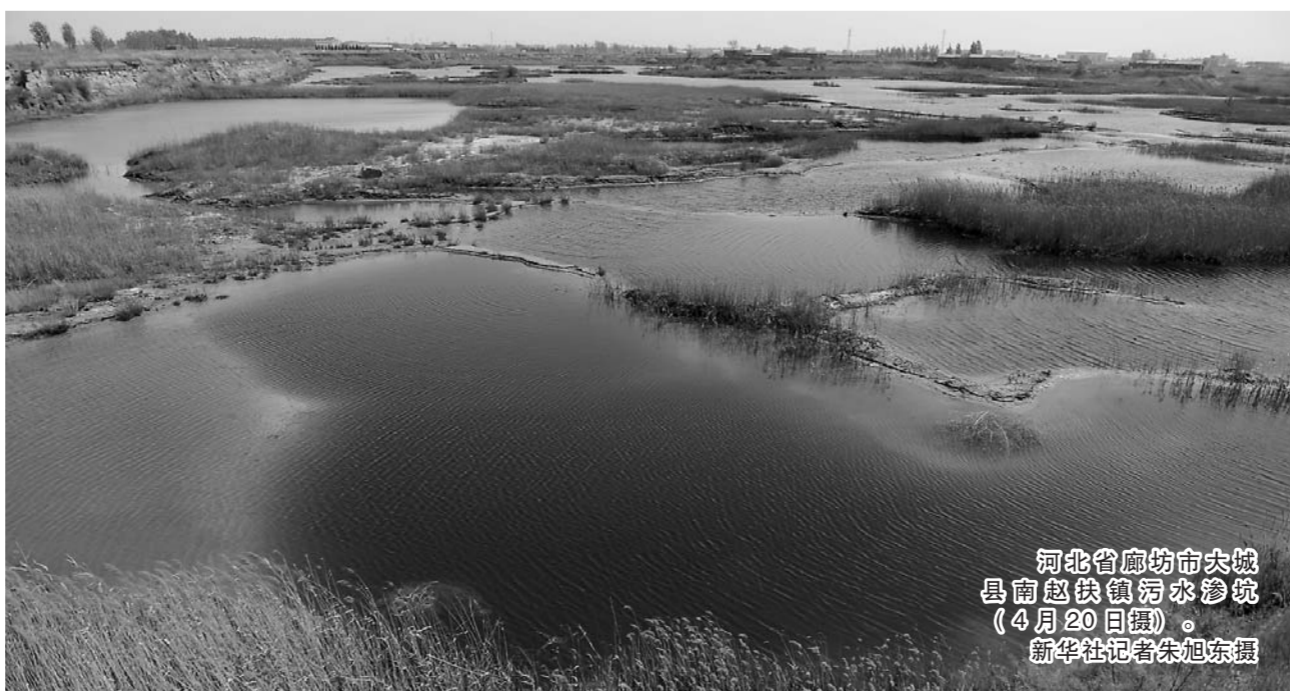
河北省廊坊市大城县南赵扶镇污水渗坑(4月20日摄)。

渗坑污染问题发生后,大城县南赵扶镇先后投资118万元,开展渗坑治理。砖厂渗坑从2014年到2016年经两次治理,但两次出现水质反弹,后治理公司以各种理由拒不再次治理。县化肥厂渗坑分别于2014年4月至当年7月、2014年10月至2016年6月进行两次治理,但由于廊坊碧水源环保设备有限公司治理水平问题,均未达到治理要求。2016年9月,大城县政府将碧水源公司起诉至大城县人民法院。2016年底,大城县政府将两个渗坑治理工程列入2017年县政府重点工程,预算3848万元。大城县县委县政府相关部门表示,两个渗坑周边都没有工业