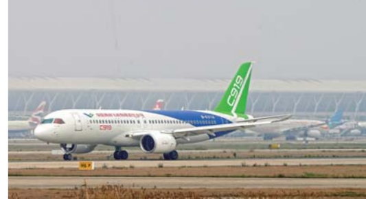
C919 完成首次跑道高速滑行测试

4月16日,国产大飞机C919在上海浦东国际机场4号跑道进行了首次高速滑行测试,测试顺利。