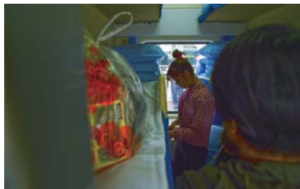
▲1月10日,犯罪嫌疑人司某某站在火车车厢内,她对正在进行的抓捕行动浑然不觉。