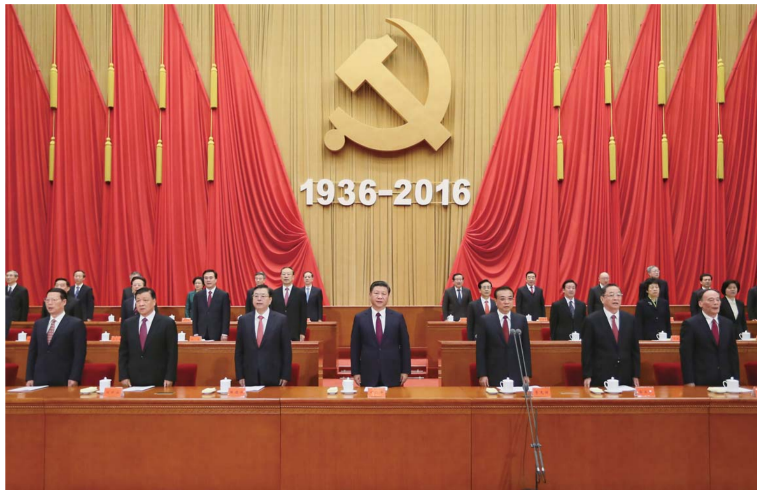
▲ 10月21日,纪念红军长征胜利80周年大会在北京人民大会堂隆重举行。中共中央总书记、国家主席、中央军委主席习近平在大会上发表重要讲话。