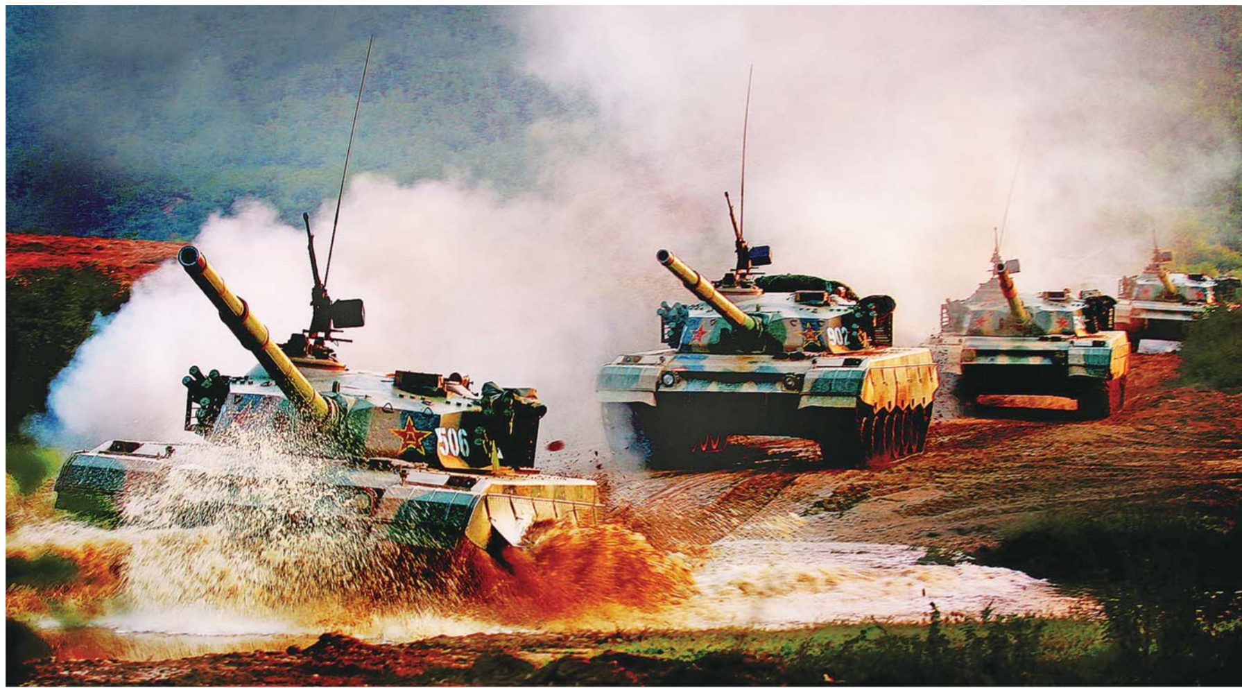
▲“铁拳——2004”演习期间，陆军第54集团军某红军师装甲战车向演习地域开进。