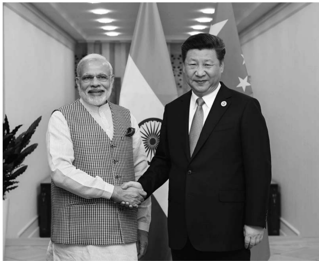
▲6月23日,国家主席习近平在塔什干会见印度总理莫迪。