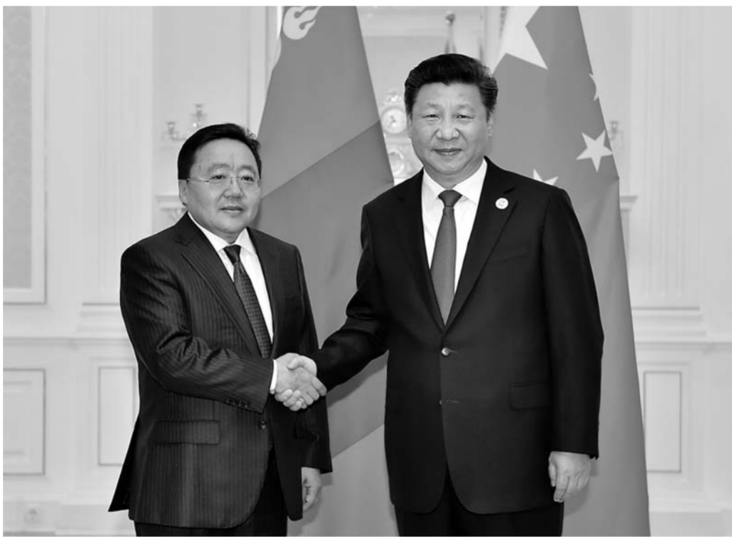
▲6月23日,国家主席习近平在塔什干会见蒙古国总统额勒贝格道尔吉。