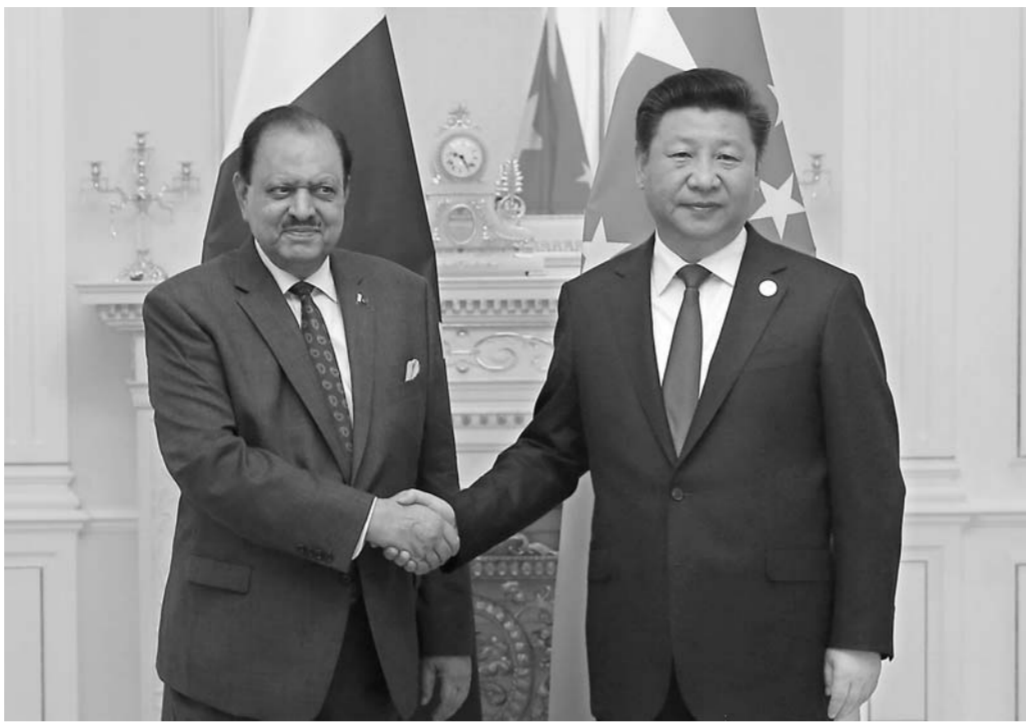
▲6月23日,国家主席习近平在塔什干会见巴基斯坦总统侯赛因。