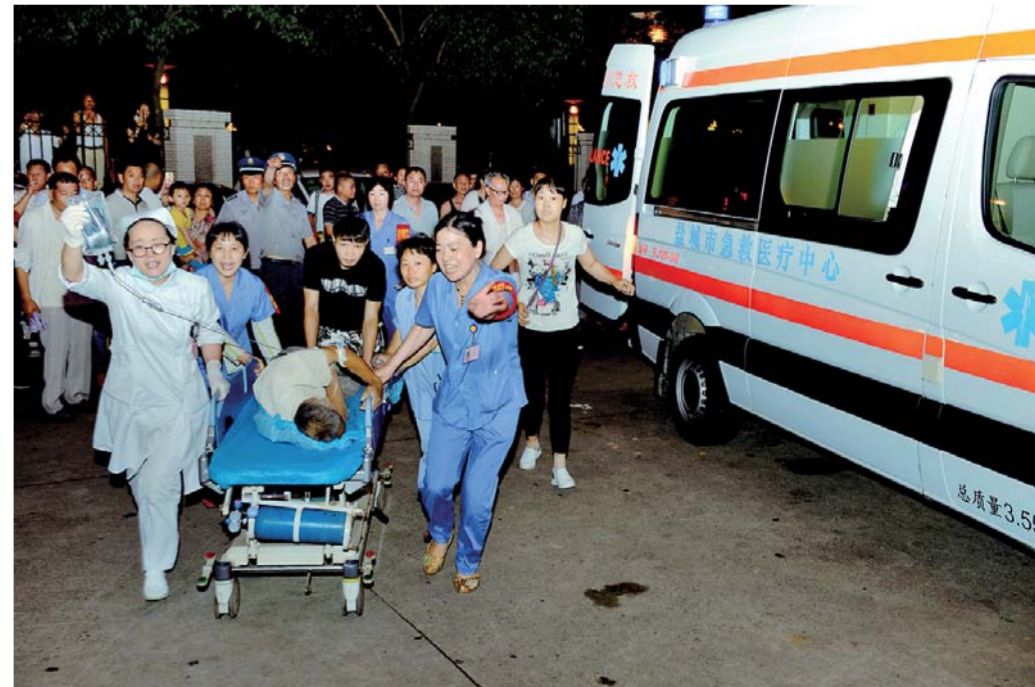
▲6月23日,盐城市第一人民医院医护人员在抢救伤员。

另据了解,目前,还有苏州、无锡、常州、镇江、南通、泰州等6个消防支队的201名消防官兵正在增援途中。